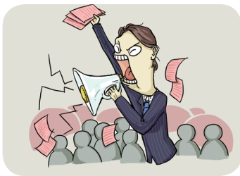
传销是骗取财物的行为