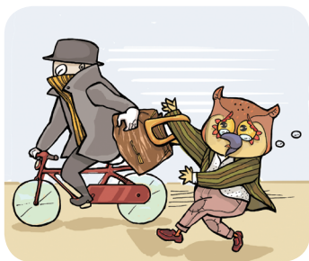
抢夺就是趁人不备