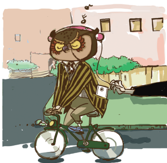
在路上不要暴露贵重物品