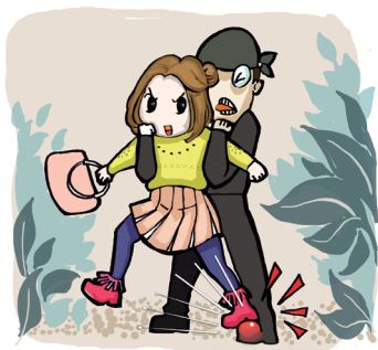
女生掌握一些自卫技能很重要