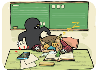
妥善保管贵重物品

案例：2011年底，北京多所高校食堂发生扒窃案件，公安机关组成专案组全力侦破，破案后发现扒窃分子主要选择将手机、钱包等放在外兜的同学下手扒窃。无独有偶，2013年底，某高校周边多次发生扒窃案，公安机关在破案后发现扒窃分子的作案目标是边听音乐、边走路或骑车的学生。