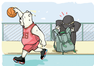
运动时要注意保管好物品

案例：2011年底，北京某高校公共教室多次发生笔记本电脑、手机被盗窃案件，学生损失较大。公安机关联合学校保卫部门全力破案，抓获犯罪嫌疑人后发现该人利用学生离开教室打水、上厕所的时机进行盗窃，作案10余起无一失手。