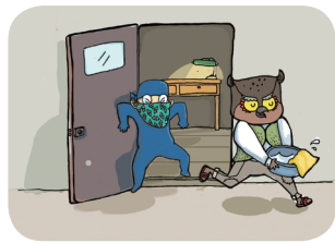
一定要随手锁门关窗