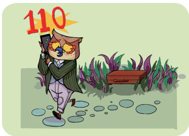
发现可疑物要报警

快速寻找汽车、树木、立柱等遮蔽物，没有则应低头趴下或下蹲；确定枪击方向后，立即利用隐蔽物反方向撤离；到达安全区后及时报警，积极自救互救。