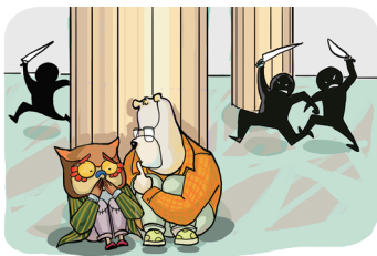
误入传销后要牢记人身安全第一