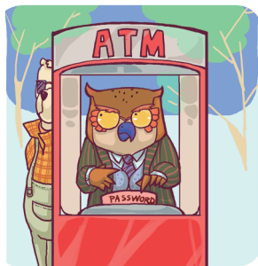
使用ATM机要格外小心