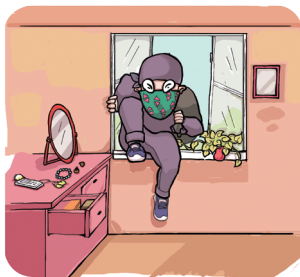
开窗外出是不安全的行为

案例：2012年底，北京某高校多间女生宿舍夜间发生盗窃案，放在宿舍的笔记本电脑、手机等物品一夜之间不翼而飞。公安机关在破案后发现犯罪分子是利用女生宿舍没锁阳台门窗的漏洞进入宿舍作案的。